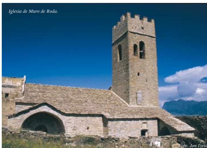
Iglesia de Muro de Roda.