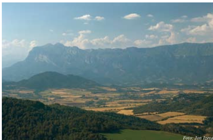
Vistas del valle de la Fueva.